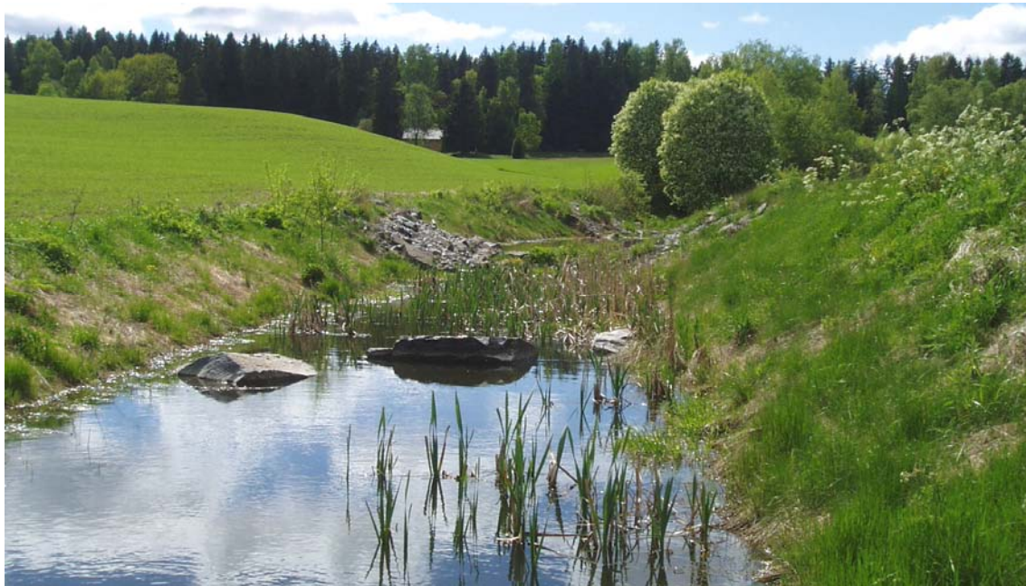
Fangdam med hoppesteiner.