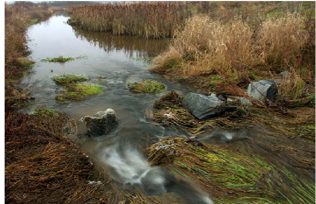
Figur 3. Fangdam om høsten, Skuterud i Ås.