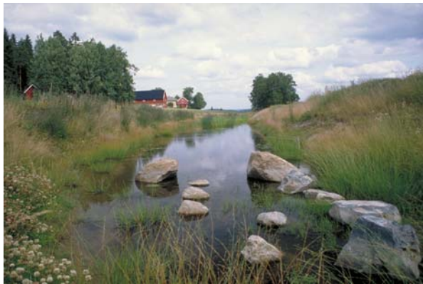
Figur 2. Fangdam som estetisk innslag i kulturlandskapet.